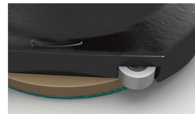
Deux roulettes murales offre une guidage régulier.