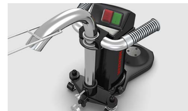
La poussière est immédiatement aspirée par le tuyau orientable.